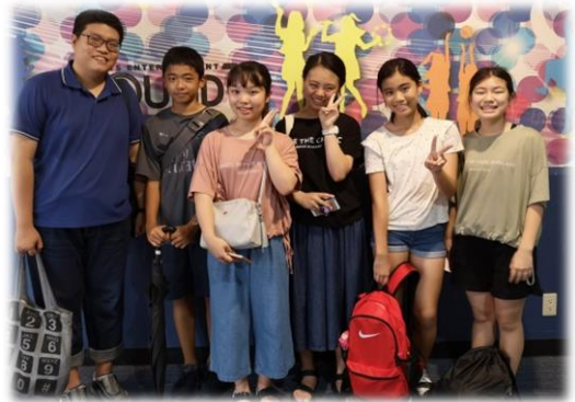
↑ 2019年、2018年に受験して本帰国した教え子と一緒にスポーツチャで遊んでました。