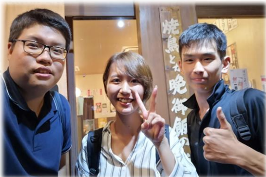
↑ まさか以前教えた中1生と一緒にお酒を飲んで車運転の話をしました。彼らはもう社会人になりました。