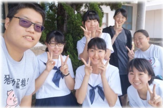
↑ 5年ぶりの教え子と再会しました。教えた時まだ小学校5年生なのに、今もう高校生になりました!