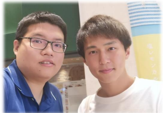
↑ 昔中学校で教えた子が今年大学に合格しました!